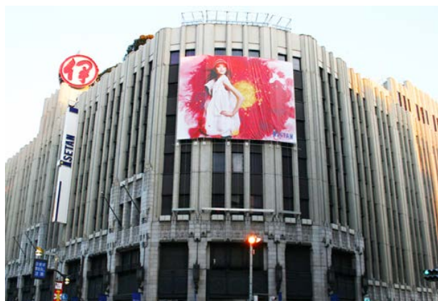
三越伊勢丹 / 広告キャンペーンを1年間、計5回手掛ける