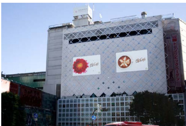
McCafe'(McDonald's Japan) / キャンペーンビジュアルを担当